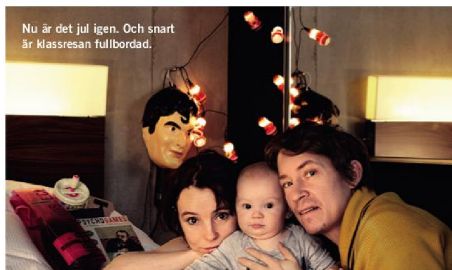
Nu är det jul igen. Och snart är Klassresan fullbordad.